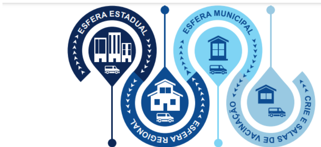
Figura 1: Desenho da rede de distribuição de imunobiológicos no estado de Pernambuco

O processo logístico que envolve a cadeia de frio considera aspectos inerentes a conservação das características originais dos imunobiológicos desde o laboratório produtor até o usuário final. No estado de Pernambuco, após o recebimento da carga mensal oriunda do nível central do Ministério da Saúde, o roteiro de abastecimento percorre por via terrestre para atender oportunamente as instâncias das regionais de saúde (11), municipais (184), Centro de Referência de Imunobiológicos Especiais - CRIE (1) e salas de imunização (2.472) (Figura 1)